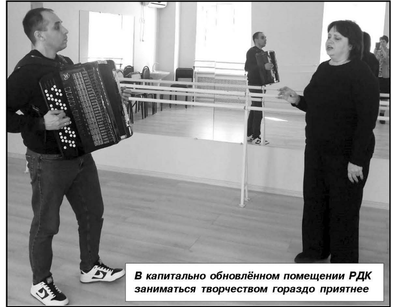
В капитально обновлённом помещении РДК заниматься творчеством гораздо приятнее

— Вы также курируете и учреждения культуры. Будет ли в этом году проводиться ремонт сельских Домов культуры, а также библиотек, расположенных в них? — Период 2020 – 2023 годов стал для учреждений культуры весь-