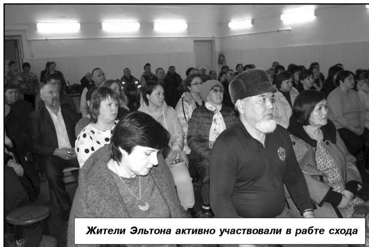
Жители Эльтона активно участвовали в работе схода

Эльтонское, как известно, самое отдалённое от районного центра поселение. Как-то «приблизить» его к Палласовке, да и к Волгограду, возможно только посредством качественной дороги. Для местных жителей этот вопрос в числе насущных и актуальных. Поэтому на сходе спрашивали и о планах капитального ремонта «убитого» участка автодороги от Вишневки до Кайсацкого, который,