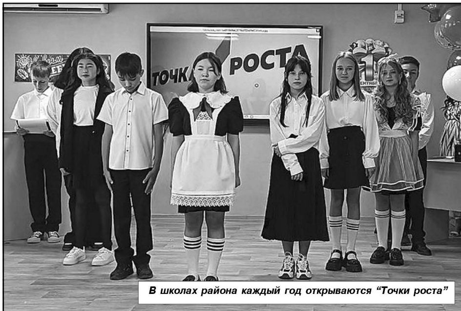
В школах района каждый год открываются «Точки роста»

От редакции: хочется отметить, что в Волгоградской области функционирует очень большое количество школ и гимназий, и немало из них нуждаются в капитальном ремонте. Факт того, что наш, Палласовский район не просто стал участником программы федерального капитального ремонта, а оказался, «самым охваченным», является результатом целенаправленной, настойчивой работы районной администрации с областными профильными комитетами, своевременной и качественной подготовки соответствующей документации.