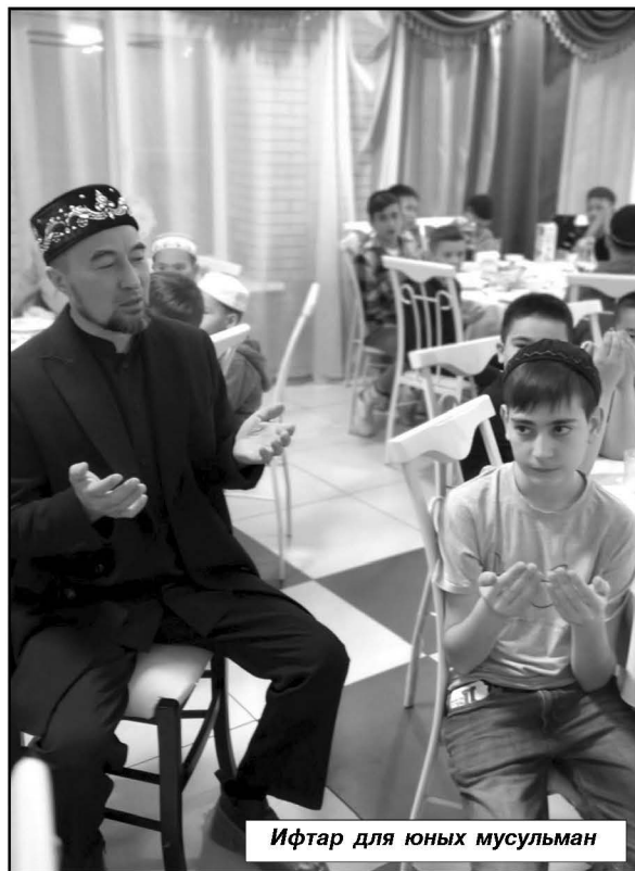
Ифтар для юных мусульман

Также в честь Ураза-байрам приглашаем всех 14 апреля на праздничное мероприятие, которое состоится на летней площадке городского парка «Торгун». Начало в 11.00