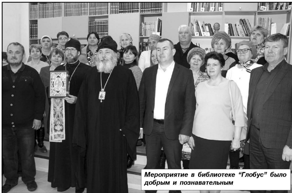
Мероприятие в библиотеке «Глобус» было добрым и познавательным

Владыка пообещал в дни Поста побывать ещё и в Эльтоне: «Наконец-то, я увижу ваши знаменитые степные тюльпаны!» А модельной библиотеке «Глобус» он собирается пода-