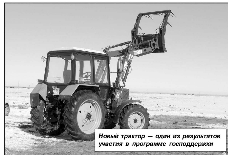
Новый трактор — один из результатов участия в программе господдержки

Хозяин в это время вместе со своим работником Юрием раздавал на базу корма животным.