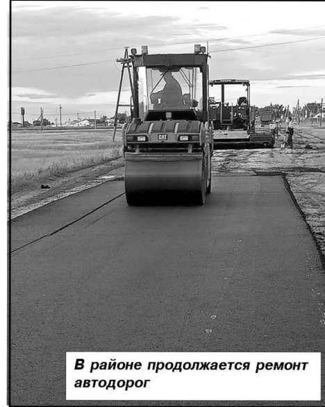
В районе продолжается ремонт автодорог

Палласовский район принял активное участие в конкурсах всероссийской агропромышленной выставки «Золотая осень 2023». Победители и призёры