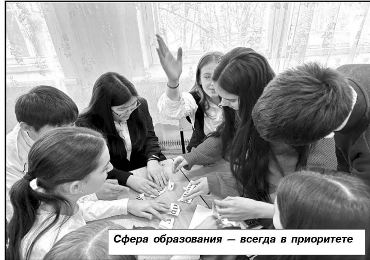
Сфера образования — всегда в приоритете

с требованиями Федеральной службы по надзору в сфере образования и науки Российской Федерации. Средний балл единого государственного экзамена по русскому языку в 11-х классах составил