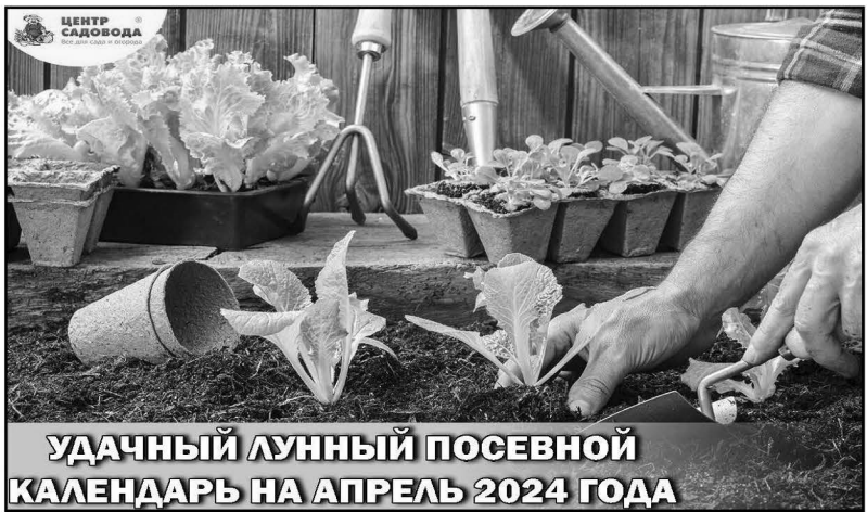
УДАЧНЫЙ ЛУННЫЙ ПОСЕВНОЙ КАЛЕНДАРЬ НА АПРЕЛЬ 2024 ГОДА

В апреле начнутся основные работы в саду и цветнике. Их будет много! Необходимо будет вовремя обработать перекопанные с осени грядки, посеять зелень, корнеплоды. Самое время посадить новые саженцы, провести обрезку ягодных кустарников. Время для обработки сада от болезней и вредителей. В апреле многие огородники высаживают рассаду в теплицы, сеют семена холодостойких культур.