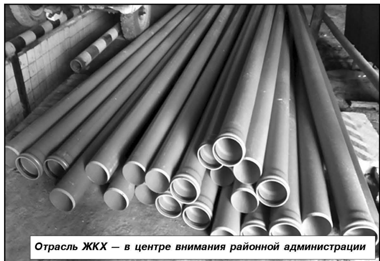
Отрасль ЖКХ — в центре внимания районной администрации