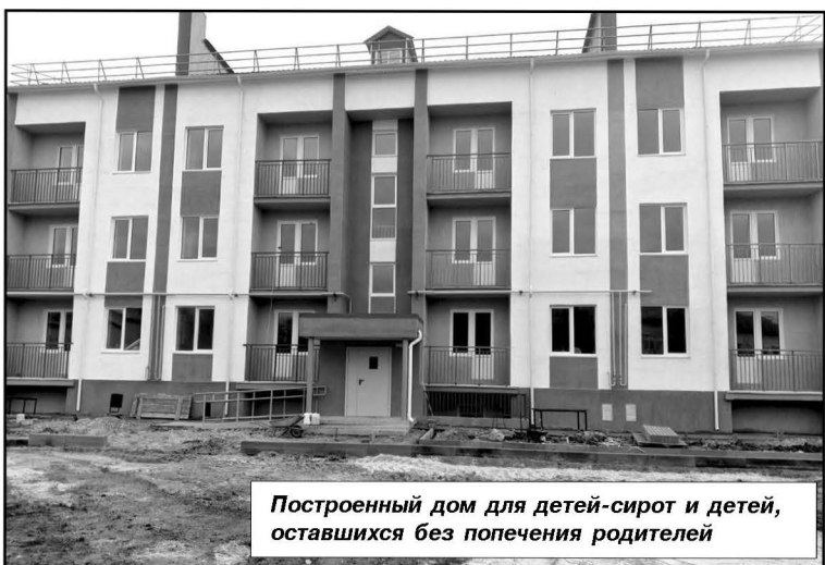
Построенный дом для детей-сирот и детей, оставшихся без попечения родителей

— налог на доходы физических лиц 284,0 млн. рублей; — акцизы (дорожный фонд) – 41,0 млн. рублей; — налоги на совокупный до-