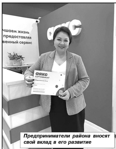
Предприниматели района вносят свой вклад в его развитие

Предприниматели района активно участвуют в конкурсах