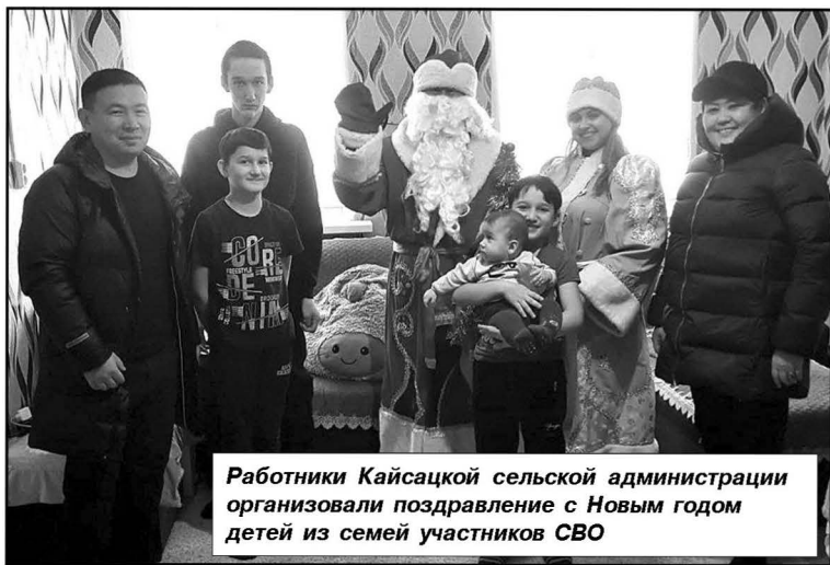
Работники Кайсацкой сельской администрации организовали поздравление с Новым годом детей из семей участников СВО