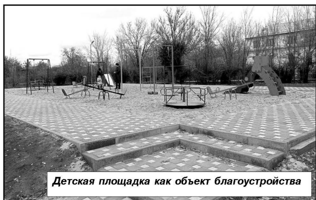
Детская площадка как объект благоустройства

— участие в конкурсах на получение президентских грантов, грантах инициативного бюджетирования