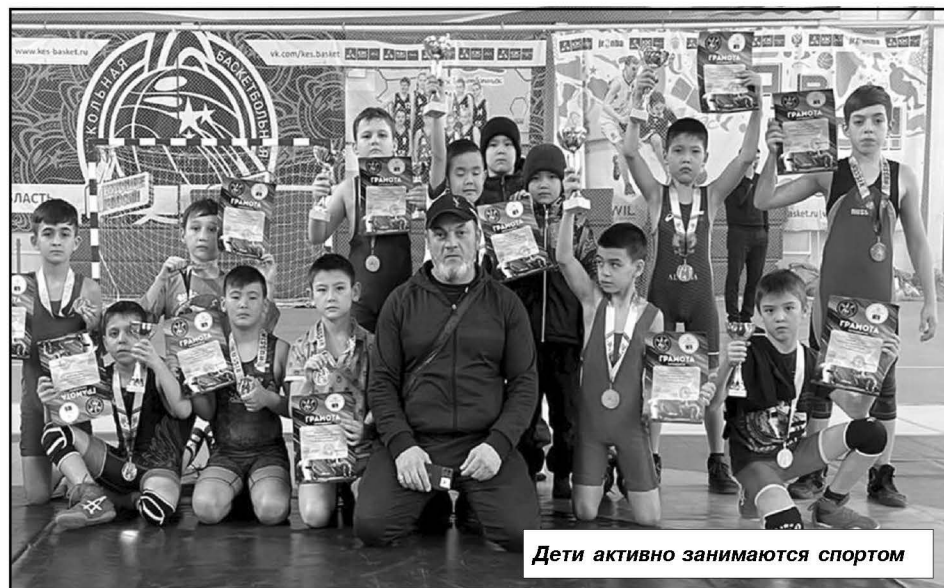
Дети активно занимаются спортом

Среди творческих коллективов Палласовского района 14 имеют звания