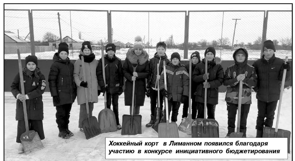
Хоккейный корт в Лиманном появился благодаря участию в конкурсе инициативного бюджетирования

Проведено благоустройство площадки для проведения праздничных линеек и других мероприятий в МКОУ «Кайсацкая СШ» на