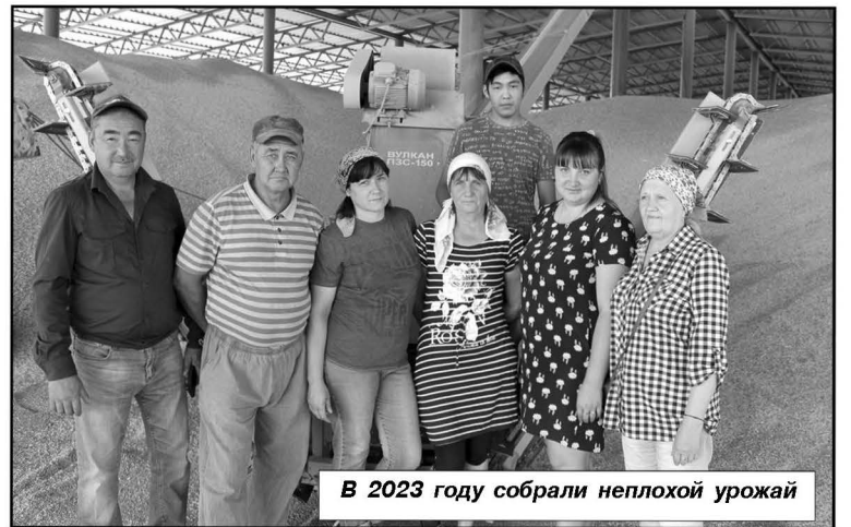
В 2023 году собрали неплохой урожай

По итогам уборочной кампании 2023 года, сельхозтоваропроизводителями получено 83,9