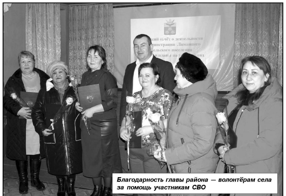
Благодарность главы района — волонтерам села за помощь участникам СВО

На развитие физической культуры и спорта было предусмотрено 1 миллион 93 тысячи рублей, из них на строительство хоккей-