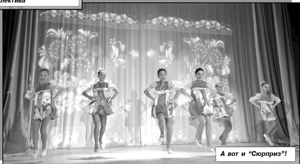
А вот и «Сюрприз»!