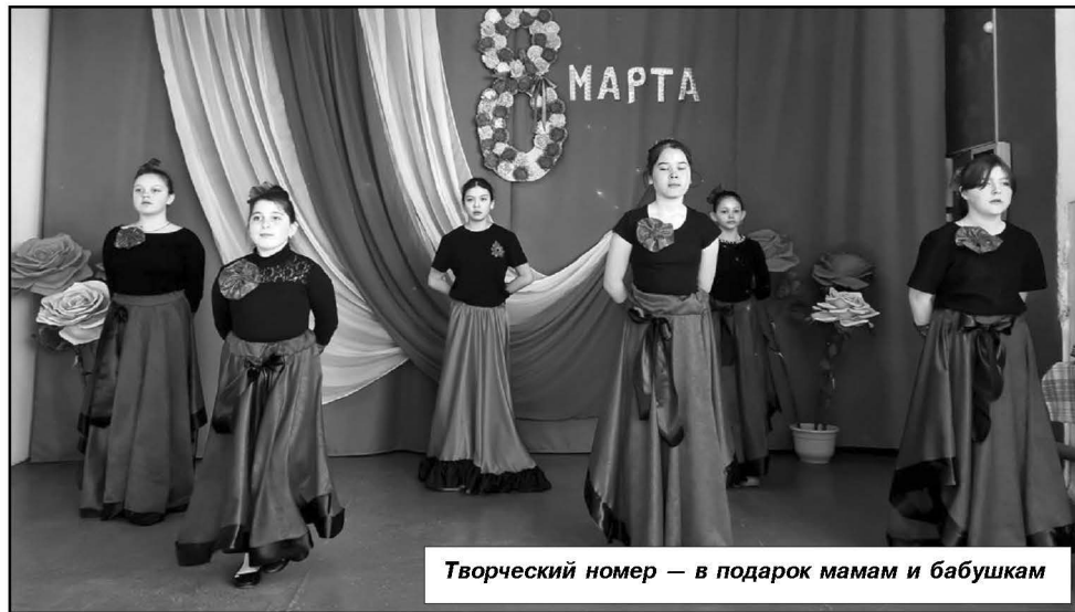
Творческий номер — в подарок мамам и бабушкам

щих на торжестве женщин, в числе которых были матери и жёны участников СВО. Собравшиеся вспомнили ребят, погибших при исполнении воинского долга в ходе специ-