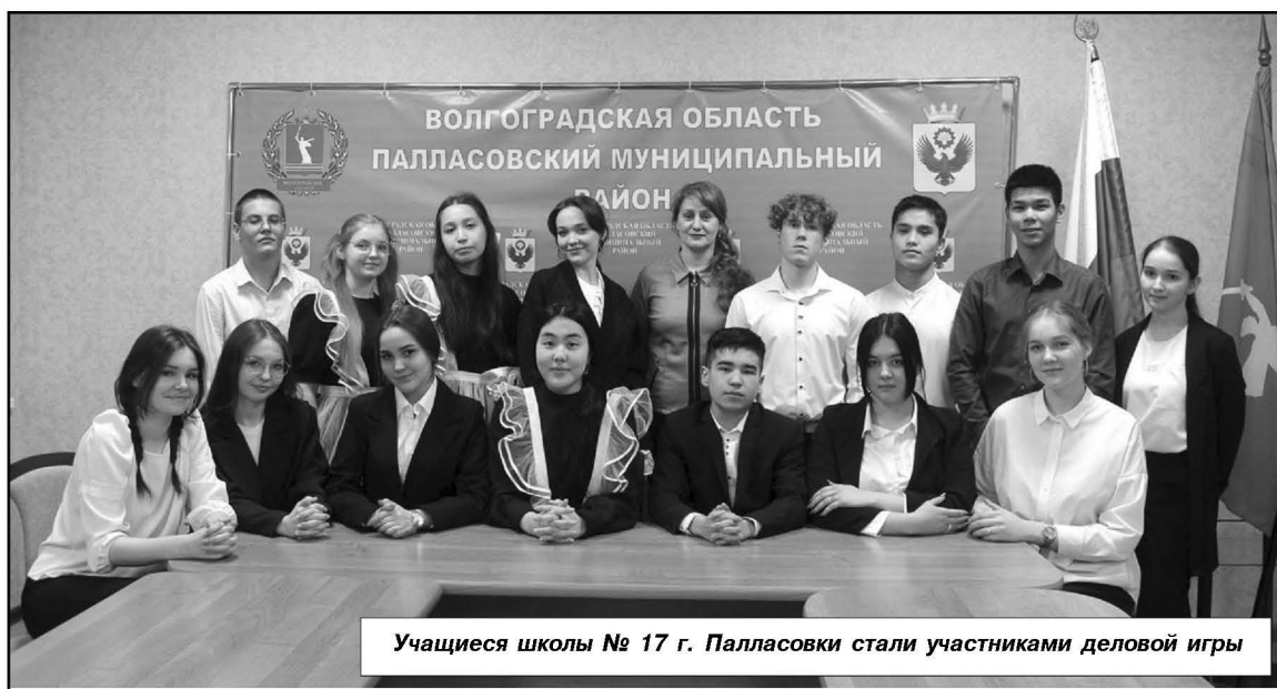
Учащиеся школы № 17 г. Палласовки стали участниками деловой игры