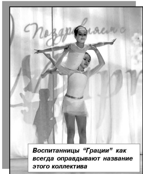
Воспитанницы «Грации» как всегда оправдывают название этого коллектива

Праздник получился необычайно добрым, волшебным и озорным. Виновицы торжества покидали зал в соответствующем, праздничном