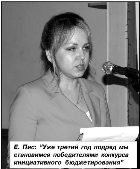
Е. Пис: «Уже третий год подряд мы становимся победителями конкурса инициативного бюджетирования»

уже третий год подряд сельская администрация является победителем конкурса инициативного бюджетирования. Благодаря активности жителей поселения в Лиманном появилась техническая вода, хоккейный корт. В 2023 году победил проект «Благоустройство парка «Аллея Славы», который будет реализован в посёлке в текущем году. Для реализации данного проекта необходимо один миллион сто двадцать семь тысяч рублей. Источниками финансирования являются: средства областного бюджета — 800 тысяч рублей; средства бюджета муниципального образования — 110 тысяч рублей; средства населения — 91 тысяча рублей. Известный в Палласовском рай-