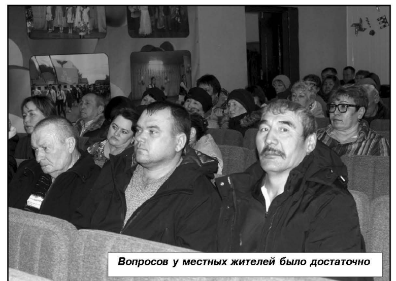
Вопросов у местных жителей было достаточно

турнир по мини-футболу, посвященный участникам СВО. В нём приняли участие: две команды из города Палласовки, а также из Кайсацкого сельского поселения. Победу одержали лиманцы.