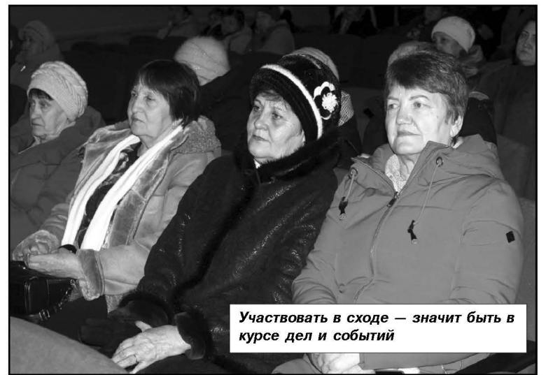
Участковать в сходе — значит быть в курсе дел и событий