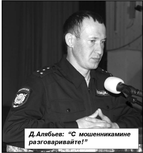
Д.Алябьев: «С мошенниками разговаривайте!»

В ноябре 2023 года волонтеры группы «Тыл Z 34» из города Палласовки предложили