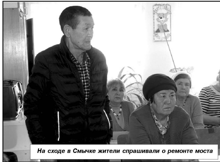
На сходе в Смычке жители спрашивали о ремонте моста