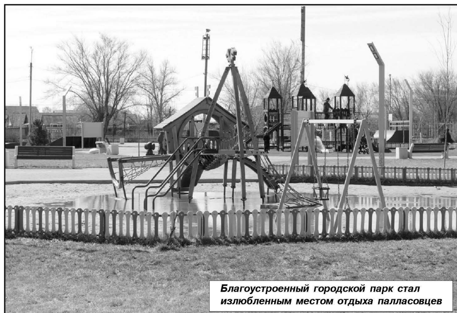
Благоустроенный городской парк стал излюбленным местом отдыха палласовцев

города; благоустройство и санитарное содержание городского кладбища; обслуживание светофорных объектов; работы по нанесению дорожной разметки пешеходных переходов; культивирование противопожарной полосы вокруг г. Палласовка; покос камыша; благоустройство пешеходных зон; установка новых дорожных знаков и подготовка территорий города и центральных площадей к новому году и празднованию 100-летия Палласовского муниципального района.