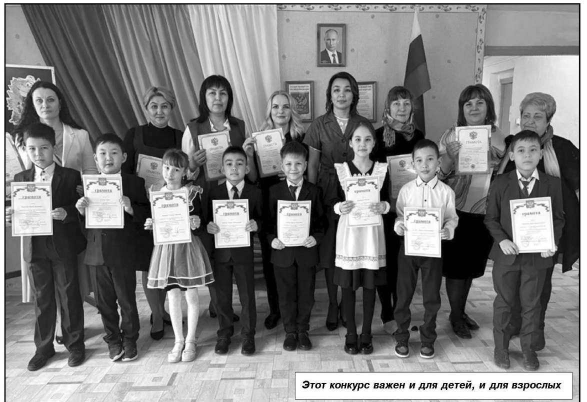
Этот конкурс важен и для детей, и для взрослых