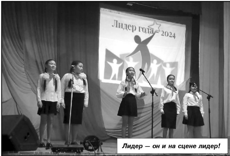
Лидер — он и на сцене лидер!

«лидер года». Члены жюри оценивали не только уровень подготовки конкурсных заданий, но и собственно лидерские ка-