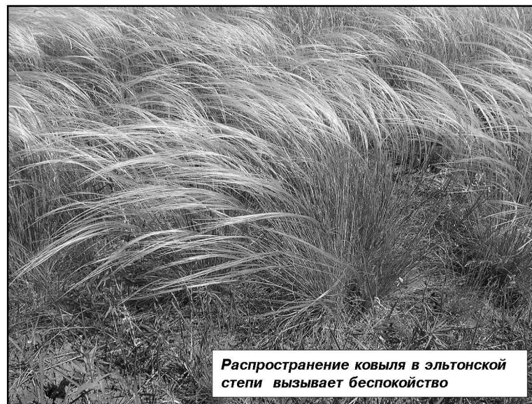
Распространение ковыля в эльтонской степи вызывает беспокойство

Продолжение в следующем номере. Михаил ЧЕРКЕСОВ.