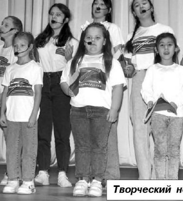
Творческий номер вокальной студии «Мажор»

У него там боевые друзья, там — его настоящая жизнь. Таких