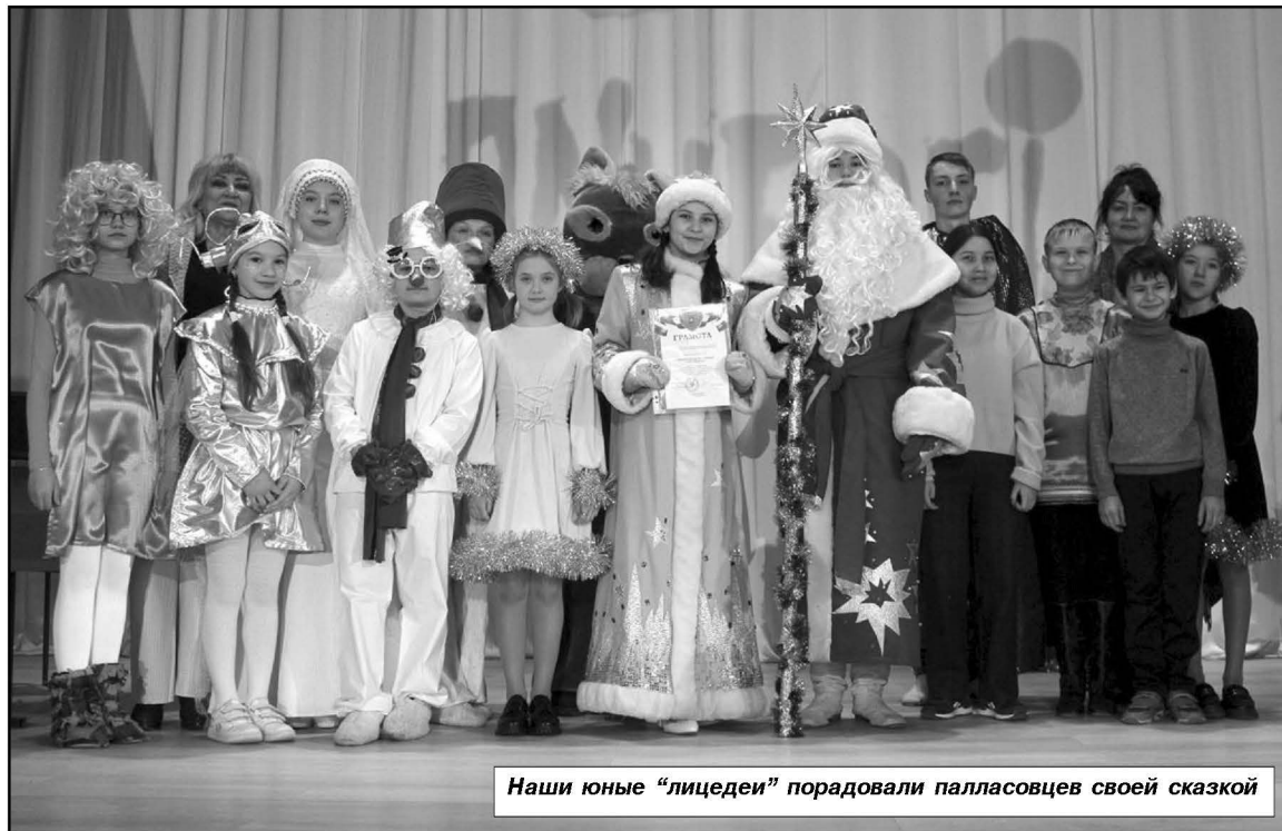
Наши юные «лицедеи» порадовали палласовцев своей сказкой

шие в зрительном зале, имели возможность хотя бы на мгновение прикоснуться к нему. Хо-