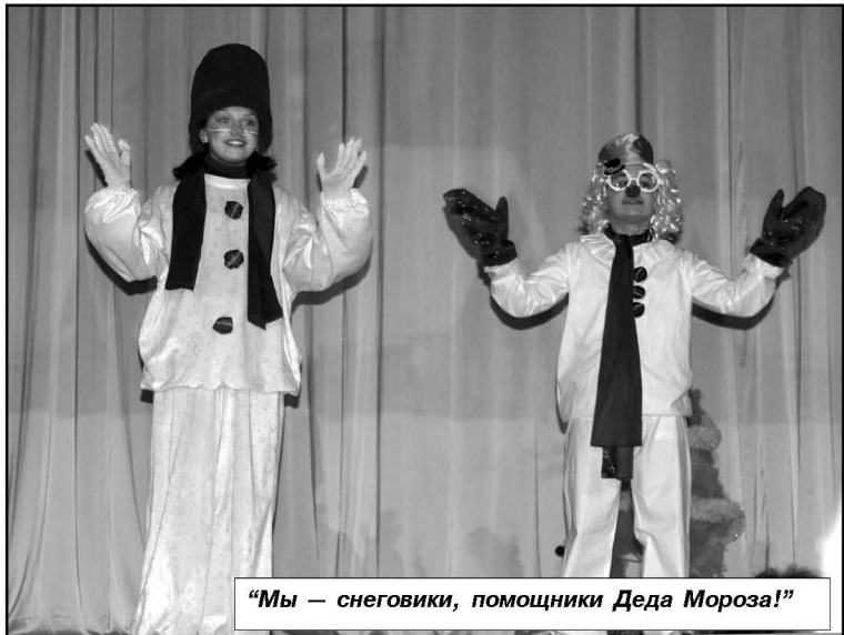
«Мы — снеговики, помощники Деда Мороза!»

своё драгоценное время на «бескрайних и часто бесполезных просторах» Интернета. И Машу, которая эту веру не растеряла, он пытался «вразумить» тем, что, мол, все рассказы о добром Дедушке Морозе — выдумки; и уж если и отправлять