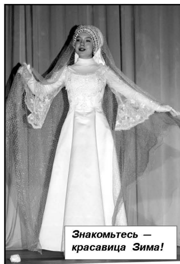
Знакомьтесь — красавица Зима!