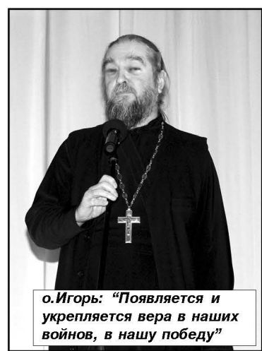
О.Игорь: «Появляется и укрепляется вера в наших воинов, в нашу победу»

«Ты же весь напичкан осколками снарядов, у тебя руки переломаны, как ты будешь служить?», — спросил я его тогда. А