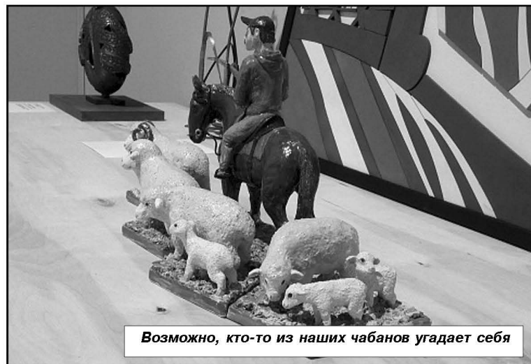
Возможно, кто-то из наших чабанов угадает себя