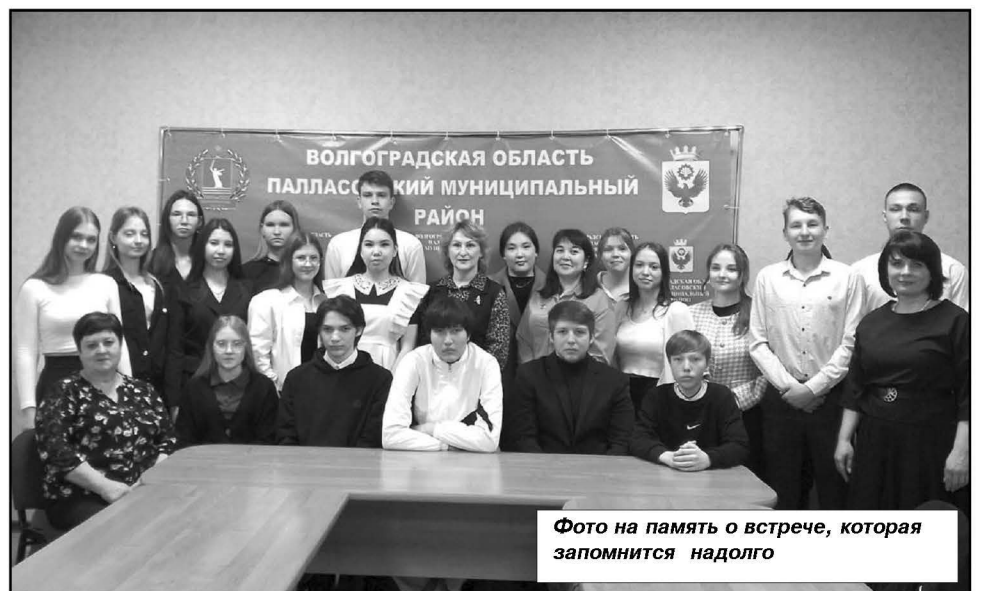
Фото на память о встрече, которая запомнится надолго

Кроме этого было упомянуто о том, что все муниципальные служащие строго выполняют и подчиняются требованиям федерального закона о муниципальной службе, Кодекса служебного поведения муниципального служащего. Всё это налагает на человека определённые обязательства, ограничения, дополнитель-