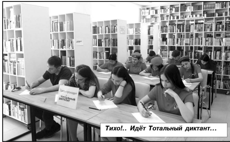
Тихо!.. Идёт Тотальный диктант...

В Палласовке акцию традиционно организовали на площадке модельной библиотеки «Глобус»; текст диктанта про-