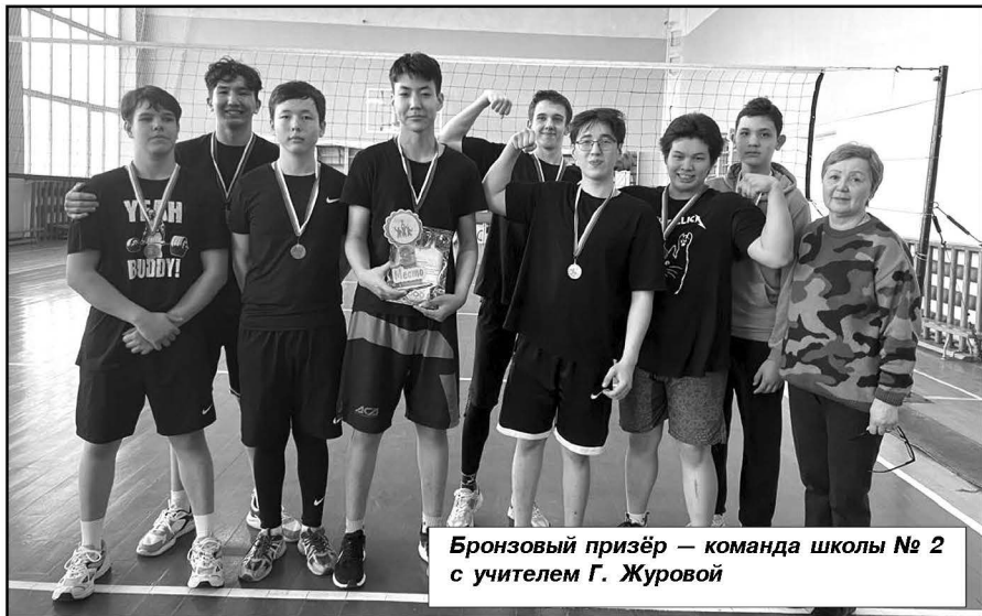
Бронзовый призёр — команда школы № 2 с учителем Г. Журовой

Подготовила Алия УТЕШЕВА.