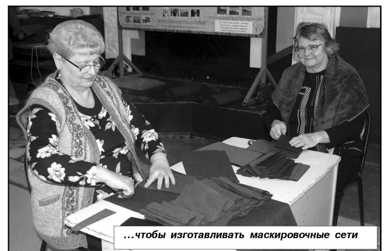
...чтобы изготавливать маскировочные сети

Вячеслав Владимирович тоже выразил слова благодарности всем неравнодушным жителям Калашниковского сельского поселения, все новостроевцам, которые не остались в стороне и оказывают посильную помощь бойцам, участвующим в специальной военной операции. «Ребята воюют ради будущего нашей Родины! Отрадно,