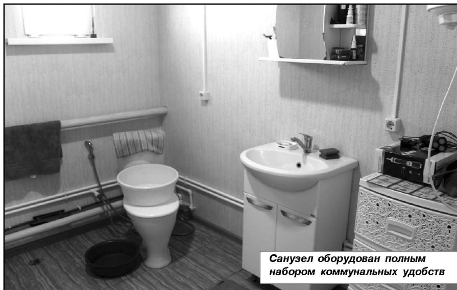
Санузел оборудован полным набором коммунальных удобств

тапливается» небольшой электропушкой; также есть возможность топить и кизами. На кухне в качестве вспомогательного энергоисточника имеется газовый баллон, подключенный к