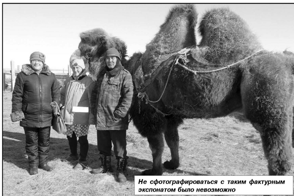
Не фотографироваться с таким фактурным экспонатом было невозможно