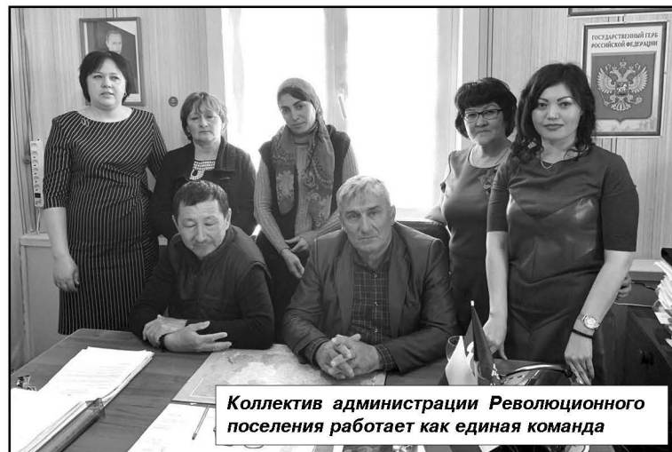
Коллектив администрации Революционного поселения работает как единая команда

Ещё хотелось отметить, что ранее был расчищен канал, подводящий к хутору воду — бесхозный, заброшенный; в Прудентове было тяжёлое положение с водоснабжением. Благодаря районной администрации, которая взяла его на свой баланс, а потом передала сель-