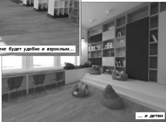
... и детьми

P.S. Отдел по культуре благодарит главу администрации Палласовского муниципального