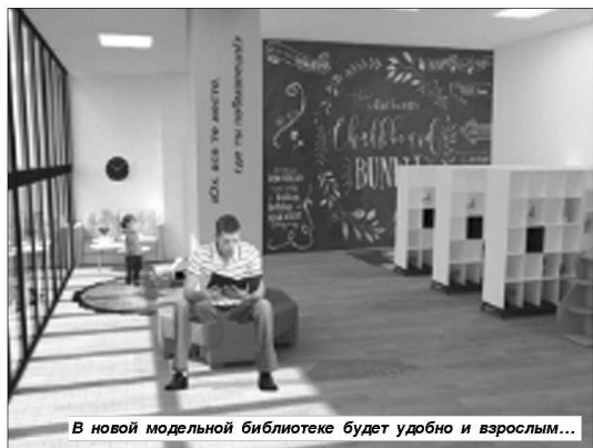
В новой модельной библиотеке будет удобно и взрослым...

проведения различных мероприятий: дискуссионных клубов, кружков, культурно-просветительских, образовательных,